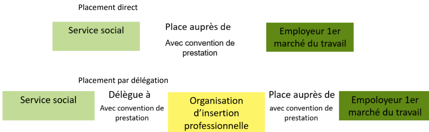
Fig. 3: Placement direct et par délégation