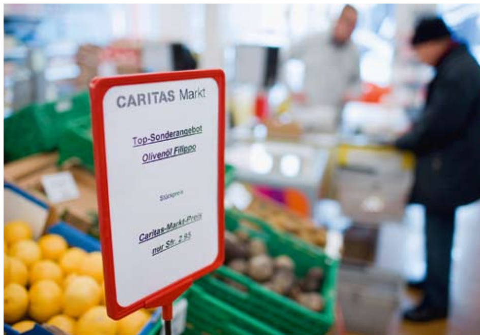
Die 4. AVIG-Revision betrifft vor allem die spezifischen Risikogruppen der Sozialhilfe wie junge Erwachsene, niedrigqualifizierte Personen und Working Poor, so dass sich die Folgen in der Sozialhilfe kumulieren können.

Jährlich vergleichen 13 Schweizer Städte im Rahmen der Städteinitiative Sozialpolitik ihre Kennzahlen zur Sozialhilfe miteinander. Im neuesten Bericht haben die Städte vertieft untersucht, wie sich die 4. Revision des Arbeitslosenversicherungsgesetzes (AVIG) auf die Sozialhilfe ausgewirkt hat. In den meisten Städten lag der Anteil an den neuen Fällen, der auf die Revision zurückzuführen ist, zwischen 5% und 15%. Insgesamt waren die Auswirkungen der Revision auf die Sozialhilfe bis anhin weniger gravierend als die Städte im Vorfeld befürchtet hatten, was im Wesentlichen der unerwartet guten Konjunktur zu verdanken ist.